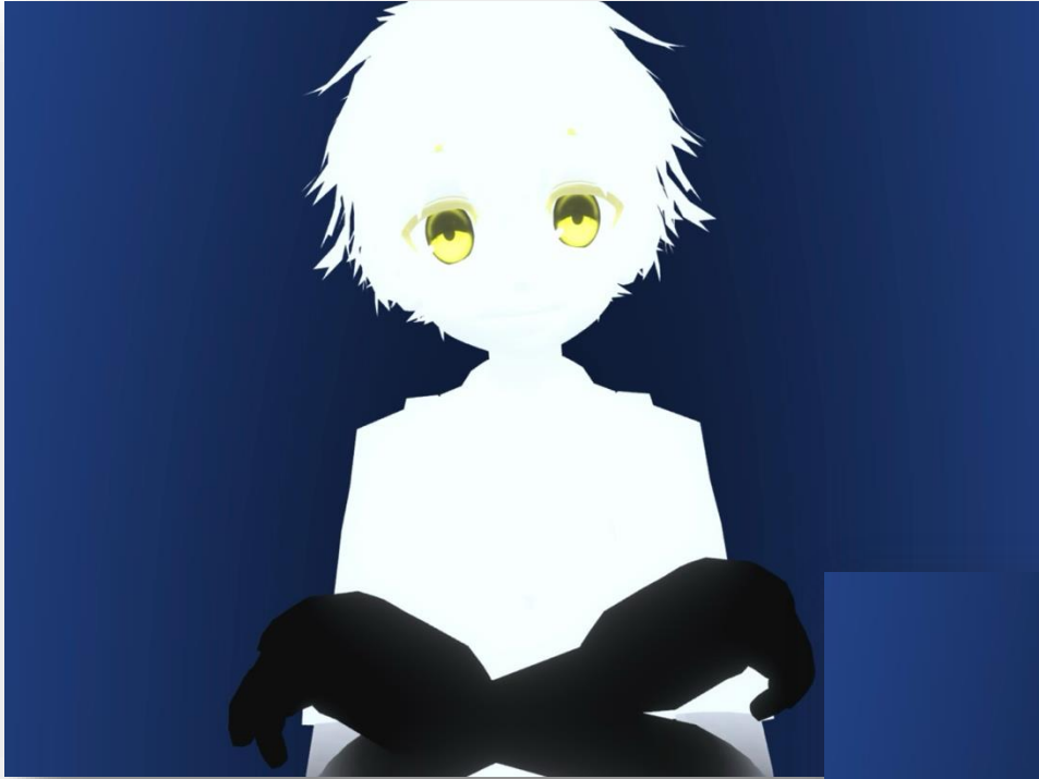
Mark 1. CiTRoくん ゆどのん工房