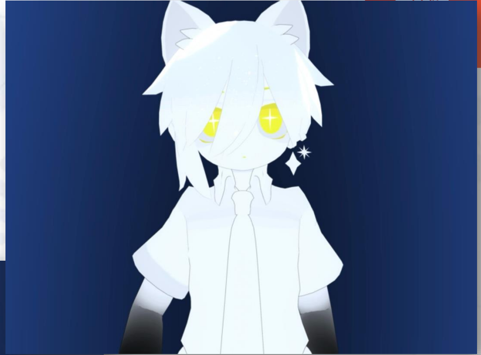
Mark 3. カルメル? くん 缶詰茶房